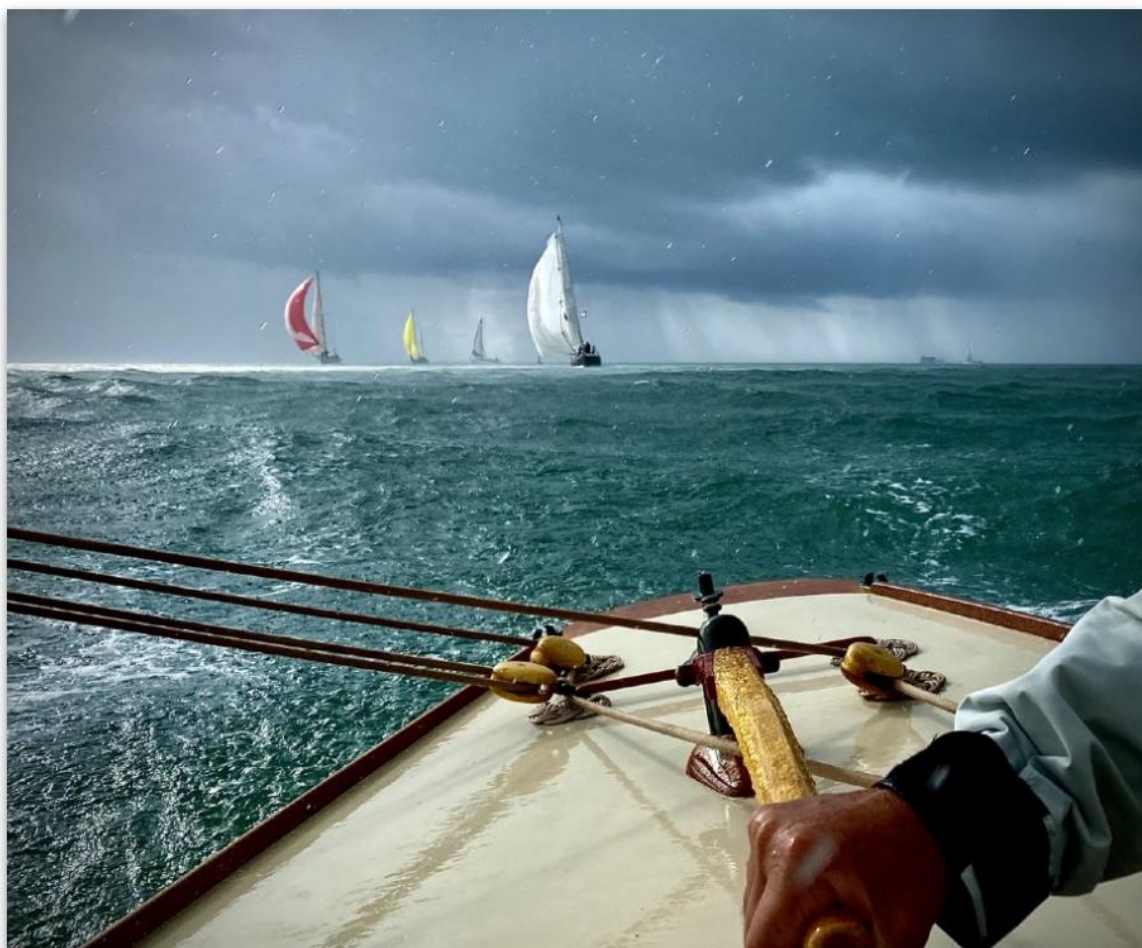
Lady Trix 1909 et ses poursuivants.

Les 7 et 8 septembre, dans nos pertuis charentais, pendant la Coupe Atlantique YCF Trophée Fernand Hervé 2024