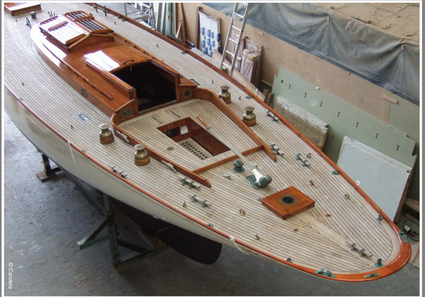
Le plan de pont de Viola