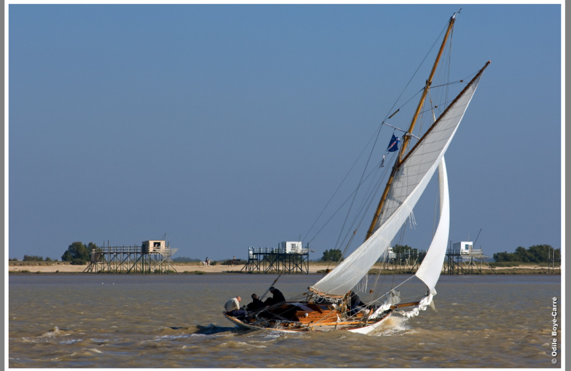
Au fil de la Charente