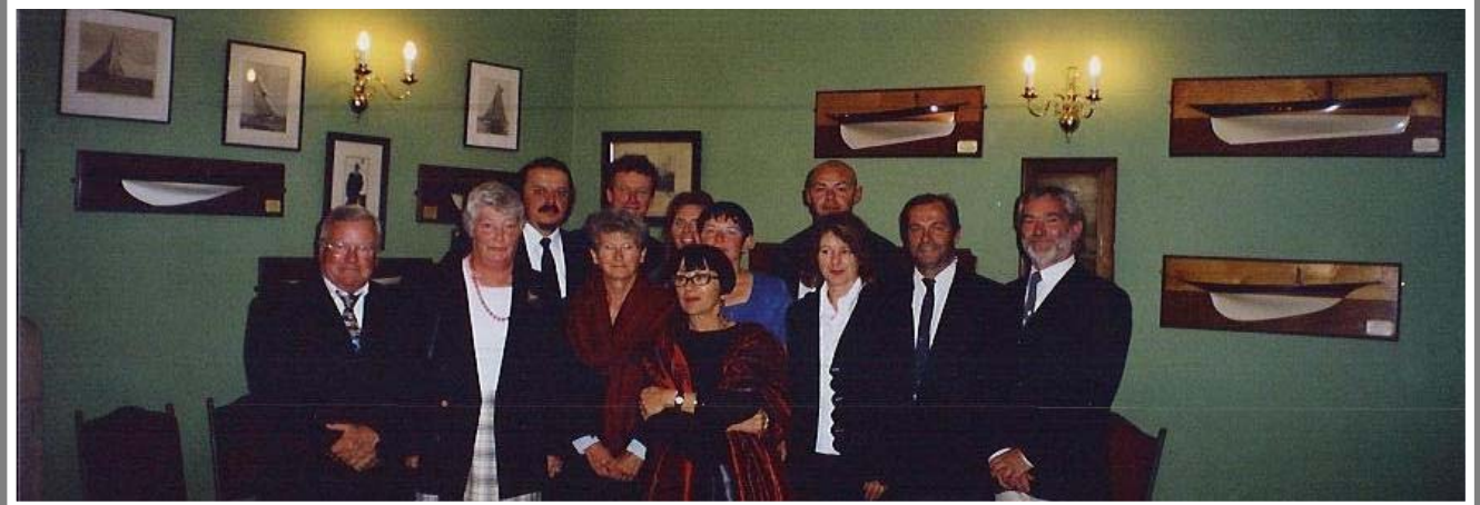
Souvenir de l'épopée 2003 (20th to 26th June, The Clyde Scotland)